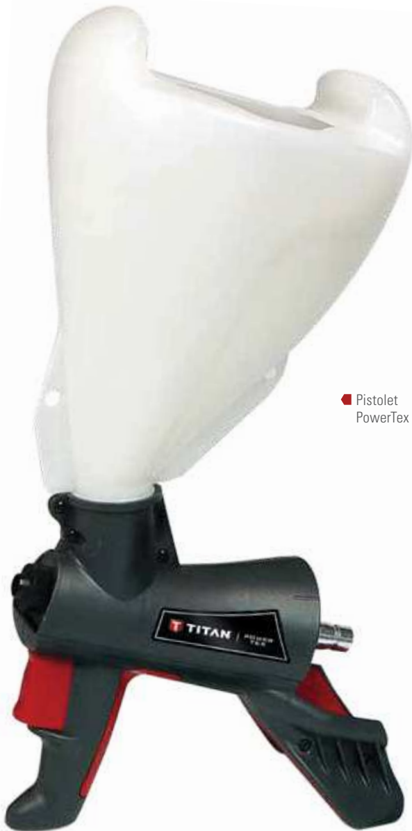
■ Pistolet PowerTex