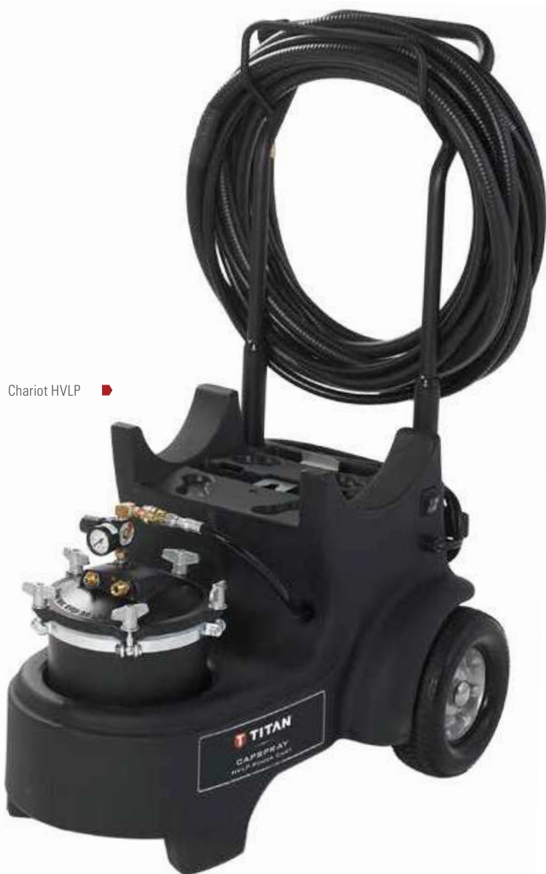
Chariot HVLP ▶